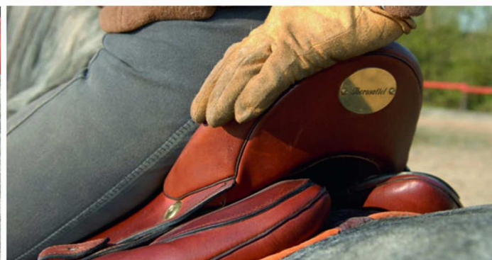
Oben: gute Passform für die Iberer-Anatomie. Links: Punkten konnte der Sattel mit solider Verarbeitungsqualität und edler Optik.